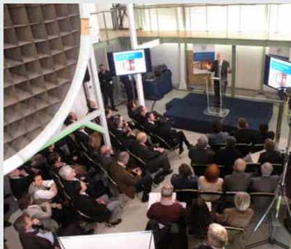
Hall de réception