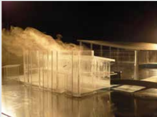
ECOTOL - LEU

Professionnels, profitez de nos installations pour former vos équipes !